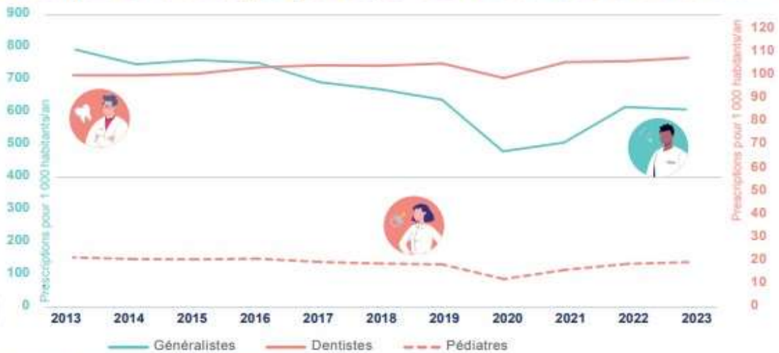
Prescriptions d'antibiotiques pour 3 spécialités médicales entre 2013 et 2023